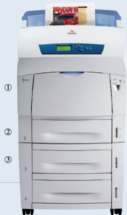
Phaser 6250DX Farbdrucker

Geld sparende und schnelle, automatische Duplexoption für den 2-seitigen Druck (Standard bei DP-, DT- und DX-Konfiguration).